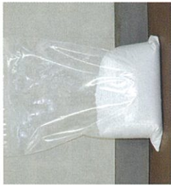
固化剤 (海水由来肥料成分)